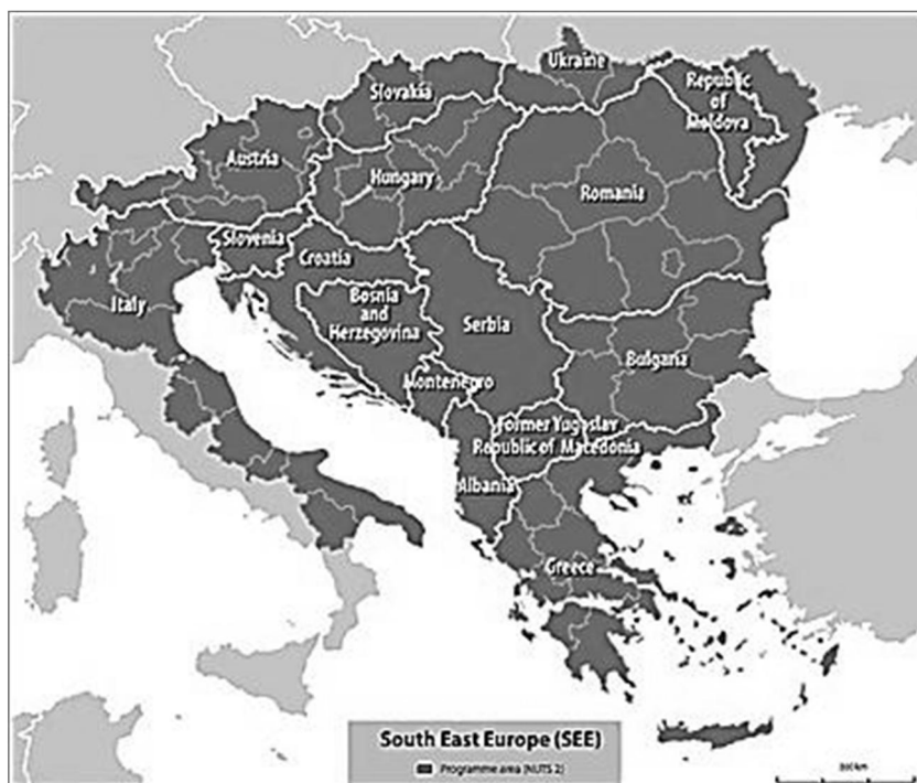
1. ábra A Délkelet-európai Transznacionális Együttműködési Program földrajzi területe

Az egyetemek és tudásparkok a főbb városi területeken és/vagy regionális gazdasági központokban koncentrálnak, így az egy lakosra jutó felsőoktatási K+F kiadások (HERD) helyzete kiválóan szemlélteti egyrészt a nyugat-, közép- és észak-európai tagállamok, másrészt a dél- és kelet-európai államok kettéosztottságát. A HERD értéke sok észak- és közép-európai tagállamban (kivéve Németország) magas (250-970 euro/lakos), míg a déli és keleti tagállamokban alacsony (0-50 euro/lakos), a fővárosok figyelemre méltó teljesítményétől eltekintve (EC 2012).