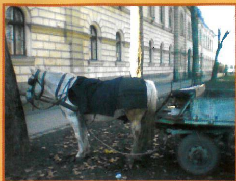
Van akinek a fejét mutatja, nem a farát ☺