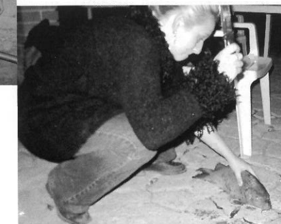
A zsákmány lebunkozása