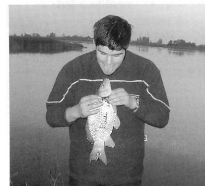
Csak haladóknak! - nyelves puszi