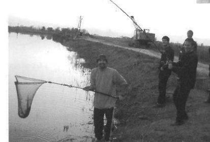
A hal kiemelése team munka