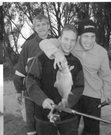
Amire büszkék vagyunk...