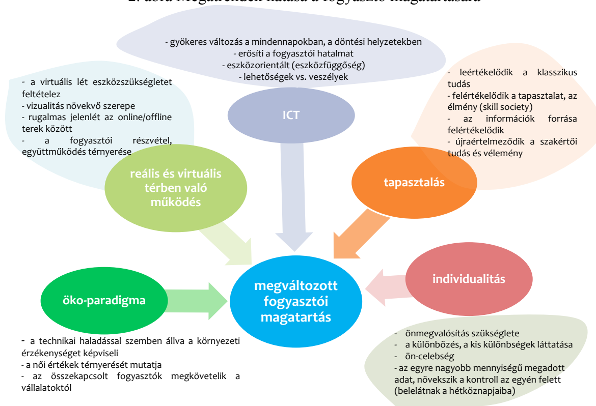
2. ábra Megatrendek hatása a fogyasztó magatartására